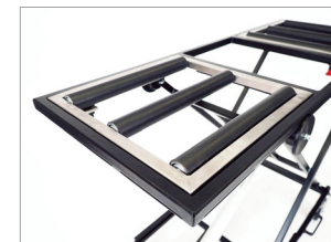
ストレッチャーと各種担架の装着早見表