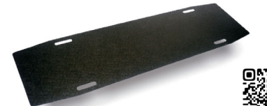
トランスファーボード L