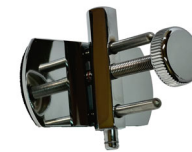
調整付き棺ストッパー

サイズ / 長さ 11.5 × 幅 15.3 × 高さ 12.5 (cm) 穴径 / 1.2 cm