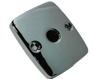
棺ストッパー固定パーツ

サイズ / 長さ 7 × 幅 6 × 厚さ 1 (cm) 穴径 / 1.2 cm