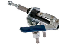
ストレッチャーロック